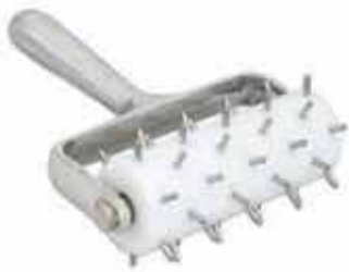
RODILLO PUNTAS DE ALUMINIO