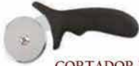
CORTADOR PIZZA MAGO POLIPROPILENO