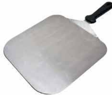
PALA PIZZA 12.25"X12.25" ACERO CÓDIGO SPAT-PEEL