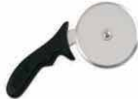
CORTADOR PIZZA MAGO POLIPROPILENO